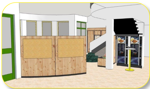
Neue Position der Automaten

Ab März werden im Eingangsbereich Umbauarbeiten durchgeführt. Mit verschiedenen Elementen, Neupositionierung der Kaffee- und Naschautomaten, sowie mit dem Einbau einer Zirmstube wird versucht diesen Bereich unseres Seniorenheimes familiärer und einladender zu gestalten. Die Arbeiten werden vor Ostern abgeschlossen sein und wir freuen uns