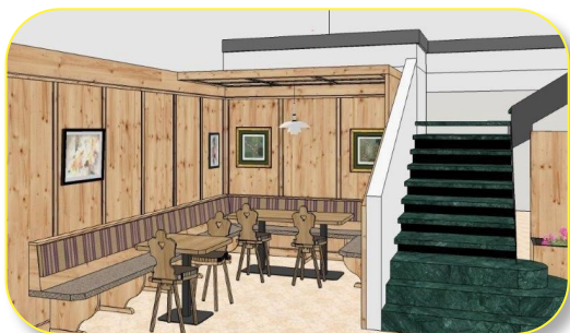
„Stube“, wo die Automaten stehen