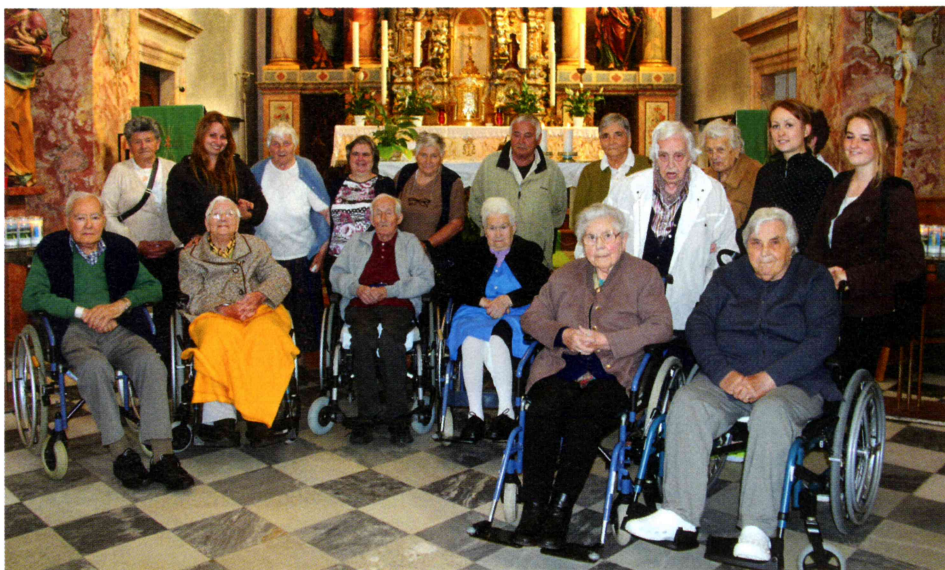
Vor dem Gnadenaltar.

11 BewohnerInnen, 3 Pflegerinnen, die Freizeitgestalterin, die Physiotherapeutin und die Präsidentin starteten bei trübem, eher kühlem Wetter am frühen Nachmittag nach Maria Weissenstein. Die Anmietung eines geeigneten Fahrzeuges für den Transport von Menschen mit Beeinträchtigungen machte es möglich, dass mehrere RollstuhlfahrerInnen mit kommen konnten.