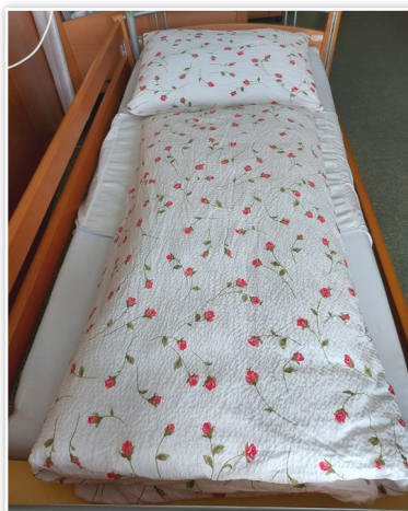
La nostra nuova biancheria da letto

In conclusione, possiamo dire quanto segue: un progetto di costruzione che doveva essere completato entro l'inizio del 2020 si è poi sviluppato in un progetto di quasi 38 mesi! Alla fine, però, tutti sono più che soddisfatti del progetto realizzato. L'intero progetto di costruzione è stato coperto da un contributo finanziario della Provincia di Bolzano e dei comuni di San Candido, Dobbiaco e Sesto. Solo la nuova biancheria è stata acquistata con i nostri fondi.