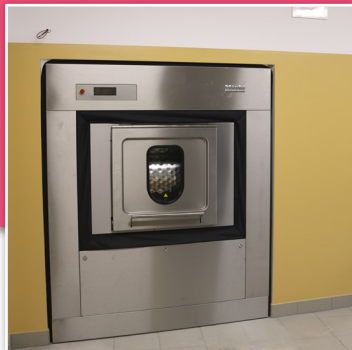
nuova lavatrice sporco-pulito