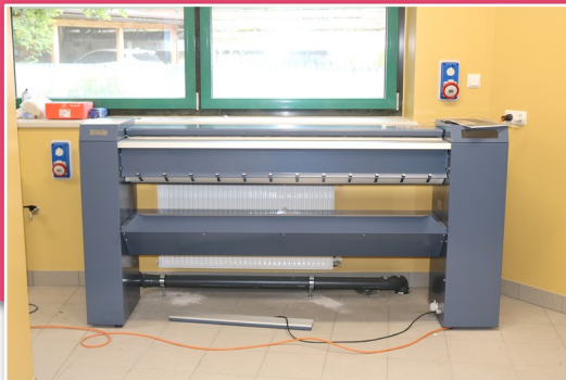
La nuova stiratrice

prefabbricata della società Betonexpert poteva essere eretta, ma il permesso per la linea di alimentazione non è stato rilasciato fino all'estate 2021. Solo allora si potevano installare i trasformatori per la media tensione. A metà marzo 2022, il momento era finalmente arrivato: la cabina a media tensione fu attivata e tutte le macchine della lavanderia poterono finalmente essere messe in funzione. La nuova lavanderia domestica del primo reparto è stata lavata in casa in via sperimentale, seguiranno i reparti due e tre nelle prossime settimane.