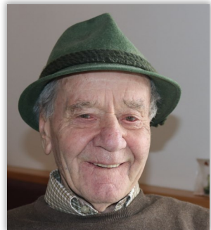
Gottfried Wieser „Der Unerschrockene“