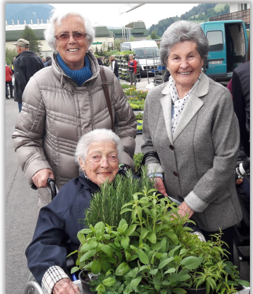
Unsere Senioren haben am Markt die Hühner und Kräuter gekauft.

H ocken die Hühner in den Ecken, kommt bald Frost und des Winters Schrecken.