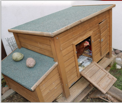
Das neue Zuhause unserer Hühner